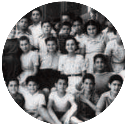
ΤΟ 1948 Ο ΚΩΣΤΑΣ ΣΗΜΙΤΗΣ ΜΕ ΛΕΥΚΟ ΜΠΛΟΥΖΑΚΙ ΚΑΙ ΣΥΓΚΡΑΤΗΜΕΝΟ ΧΑΜΟΓΕΛΟ ΚΟΙΤΑΖΕΙ ΚΑΤΕΥΘΕΙΑΝ ΣΤΟΝ ΦΑΚΟ. ΕΙΝΑΙ ΜΑΘΗΤΗΣ ΤΟΥ ΔΗΜΟΤΙΚΟΥ ΚΑΙ ΜΑΛΛΟΝ ΔΕΝ ΦΑΝΤΑΖΕΤΑΙ ΠΩΣ ΟΤΑΝ ΜΕΓΑΛΩΣΕΙ ΘΑ ΓΙΝΕΙ ΠΡΩΘΥΠΟΥΡΓΟΣ